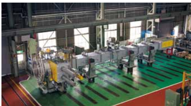
大型造粒機 (CMP387) Continuous Mixer+Pelletizer

In the field of film-and-sheet manufacturing, JSW offers a variety of machines for producing biaxially oriented film, non-oriented film for optical use, and film for high functional materials such as separator film for lithium-ion battery.