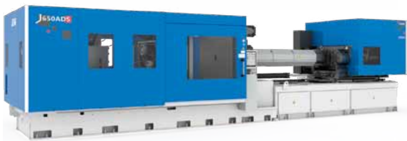
大型射出成形機 Large-Size Injection Molding Machines