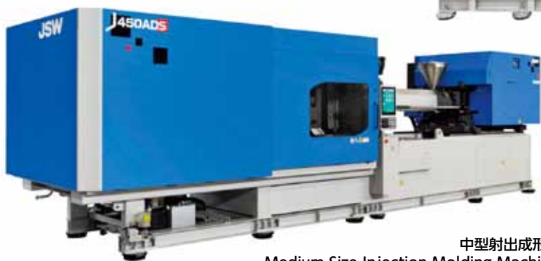
中型射出成形機 Medium-Size Injection Molding Machines