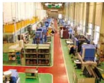
射出機センター Injection Molding Facilities for Experiment

JSW グループでは、地球にやさしいものづくり企業を目指し、ESG にかかわる取り組みとして環境配慮型製品の開発、廃棄物の削減、環境負荷物質の低減にグループ全体で取り組んでいます。当製作所では 1998 年に環境マネジメントシステムにおける国際規格 ISO14001 の認証を取得しました。また、地域社会に根差した企業を目指して、2003 年より毎年、クリーンキャンペーン（工場周囲の清掃活動）を実施しています。事業活動を通じて社会に貢献するとともに、より良い社会の実現を目指します。