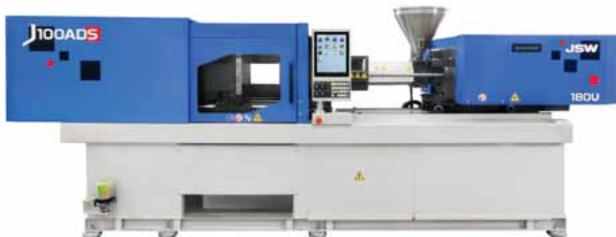
小型射出成形機 Small-Size Injection Molding Machines

By means of sales and after-sales networks established for not only Japan but also across the United States, Europe and Asia, we have actively offered technical supports including consulting services for factory automation.