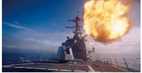
62口径5インチ砲 5-inch Naval Gun System

日本製鋼所M&E株式会社の素材技術と当所のシステム設計・加工・組立・評価技術を統合し、機関砲、戦車砲、りゅう弾砲、艦載砲をはじめ、ミサイル発射装置、自走対空機関砲システム等のシステム兵器まで、わが国に適した多種の防衛機器を提供しております。また、最新の加工設備、検査設備を備え、研究開発—設計—製造—試験—評価を一貫してできる体制を整備しております。