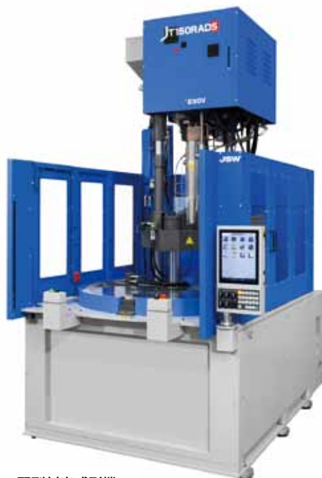
縦型射出成形機 Vertical type Injection Molding Machines