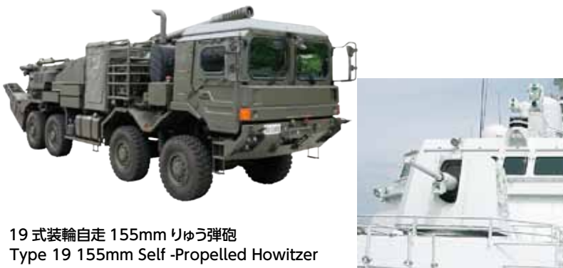
19式装輪自走155mmりゅう弾砲 Type 19 155mm Self-Propelled Howitzer

Since its founding in 1907, the Company has been thriving on a blend of traditional work ethics and state-of-the-art technology. This combination enable us to develop and produce defense-related supplied of the highest performance and quality that are renowned worldwide. For example, the accumulated expertise derived from the specialty steel production at our Japan Steel Works M&E, Inc. in addition to the system design, processing, assembly, and testing technology of our Hiroshima Plant and up to the technical process required for the production of machine guns, tank guns, and howitzers, as well as naval guns, missile launching systems, and self-propelled anti-aircraft gun systems supplied by the Company to Japan's Self-Defense Force. In the same vein, Japan Steel Works can rely on cutting-edge processing technology and inspection facilities that live up to all conservable standards. Thanks to our special facilities that enable, we can offer an integrated system of research and development, design, production, testing, and evaluation.