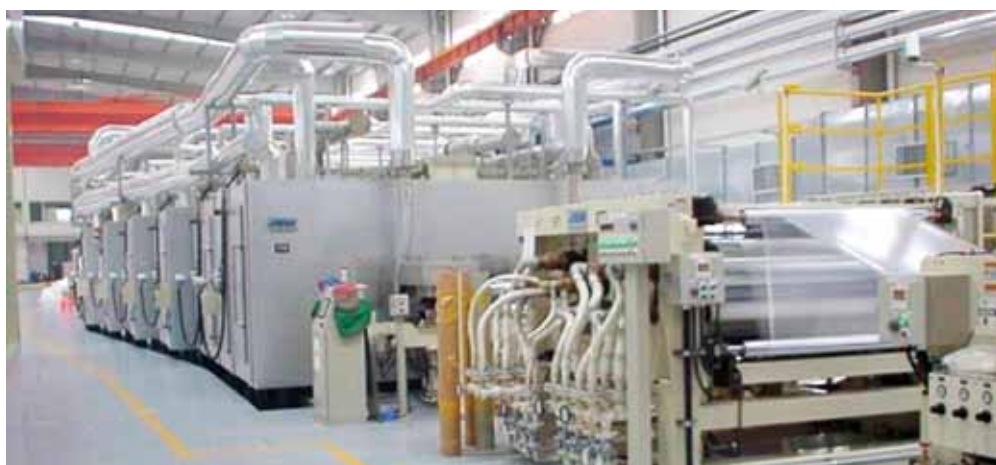
二軸延伸フィルム装置 Film&Sheet Production System