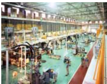
押出実験棟 Extrusion Facilities for Experiment

JSW has established a center for general plastics technology that assists customers in solving problems related to plastics processing.