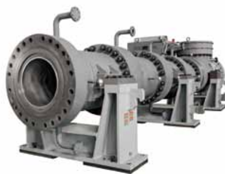
単軸押出機 (P800) Plastic Processing Extruder