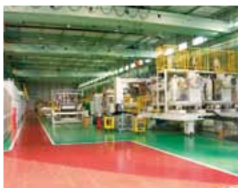
フィルム実験棟 Film&Sheet Making Facilities for Experiment