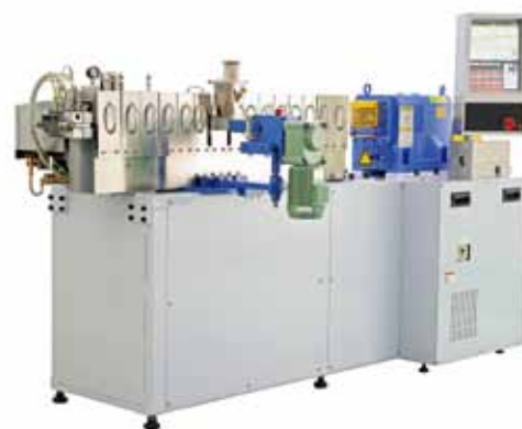
研究用小型二軸混練押出機 (TEX25αIII) Twin Screw Extruder for R&D