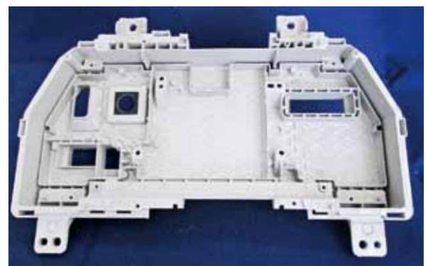
自動車用メーターケース Meter case for automobiles

マグネシウム合金は、実用金属中もっとも軽量で、堅牢性、放熱性、電磁波シールド性も兼ね備えた、優れた素材です。マグネシウム合金の成形法のひとつであるチクソモールディング (Thixomolding®) 法は、溶解炉が不要で、防燃ガスも必要ない地球・作業環境に優しい工法です。日本製鋼所は、このチクソモールディング法を適用したマグネシウム射出成形機の開発・製造・販売を一貫して行っています。