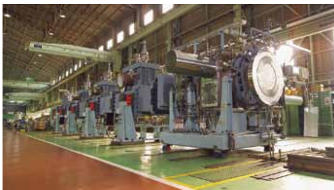
脱揮用大型二軸押出機 (TEX400α) Twin Screw Extruder for Devolatilizing Process and Pelletizing Equipment